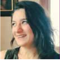
IRMAK DALGIÇ @irmkdlgc